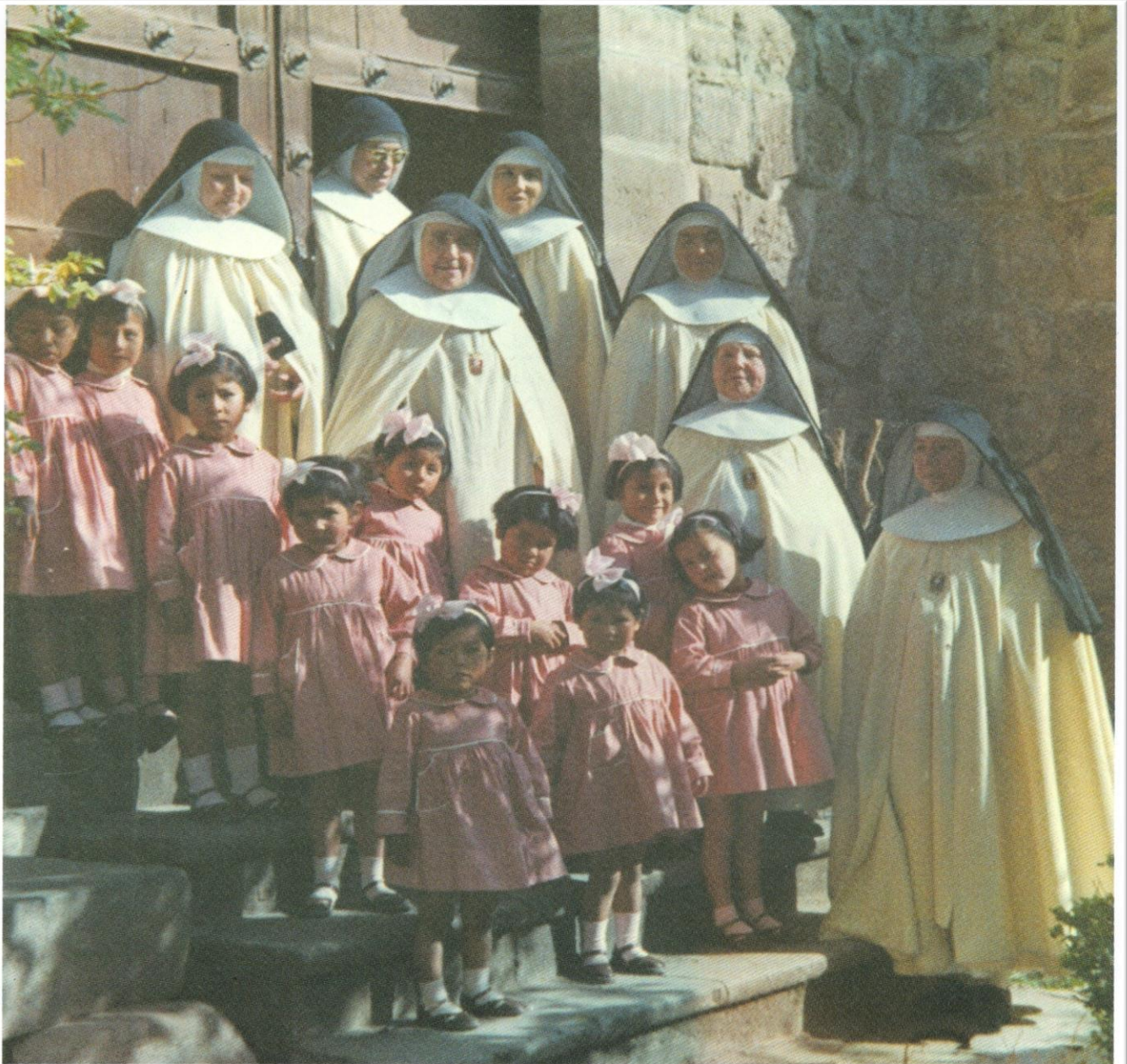
Asilo de la Infancia. CUZCO. Perú.